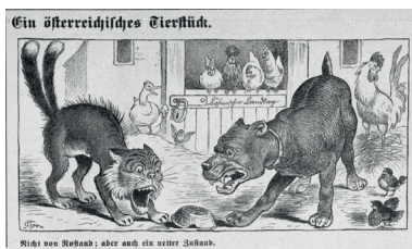
Kikeriki!, 27. Februar 1910