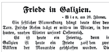
Reichspost, 29. Jänner 1914