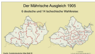
Sudetendeutscher Atlas, Blatt 26, 1954